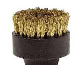
SZCZOTKA 38 mm z włosiem mosiężnym DGKIT0815/O