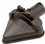
MOP TRÓJKĄTNY z rzepami i klamrami – para DGKIT07010