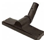
SZCZOTKA podłogowa 30 cm DGKIT0804